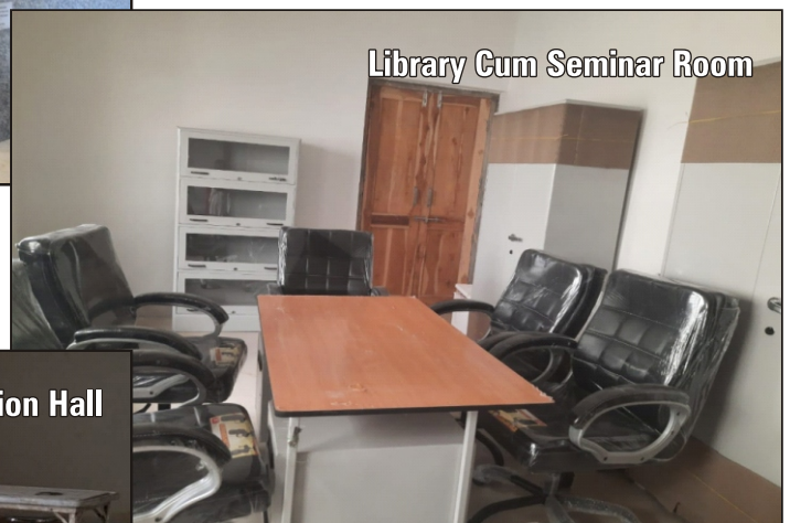
Library Cum Seminar Room